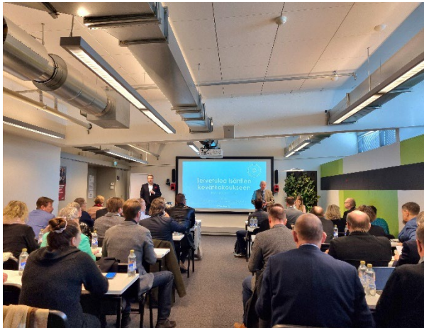
Isäntien kevätkokous Turun Logomossa helmikuussa 2023. Isännät tutustuivat samalla kokousmatkalla Turun konttorin uusiin toimitiloihin.