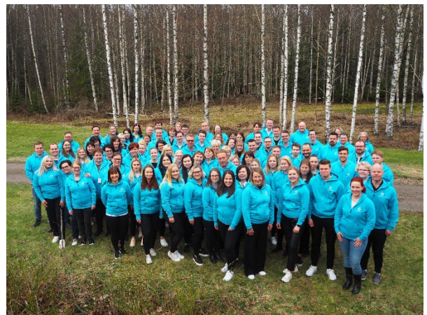
Someron Säästöpankin henkilökuntaa henkilöstöpäivässä Nuuksiassa keväällä 2023.

Pankin palveluksessa oli vuoden lopussa 116 (106) henkilöä, joista kokoaikaisia oli 100 (99) ja osa-aikaisia 16 (7) henkilöä. Henkilömäärä kasvoi vuoden aikana 10 henkilöllä. Henkilökunnan keski-ikä oli tilinpäätöshetkellä 42 vuotta.