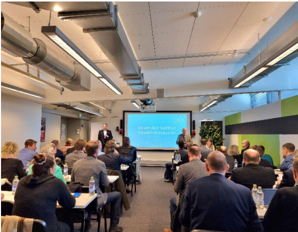
Isäntien kevätkokous Turun Logomossa helmikuussa 2023. Isännät tutustuivat samalla kokousmatkalla Turun konttorin uusiin toimitiloihin.