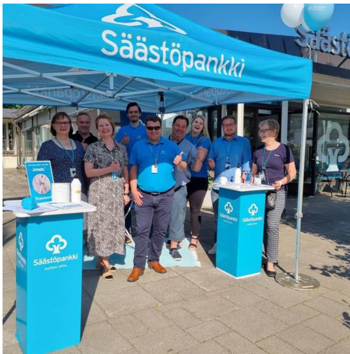
Akaan konttorin, Sp-Koti Akaan ja Sp-Isännöintipalvelujen henkilökuntaa Akaassa konttorin 1v.-juhlassa.